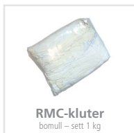
RMC-kluter bomull – sett 1 kg