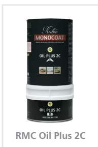
RMC Oil Plus 2C

Se emballasjen og sikkerhetsdatabladet for mer informasjon.